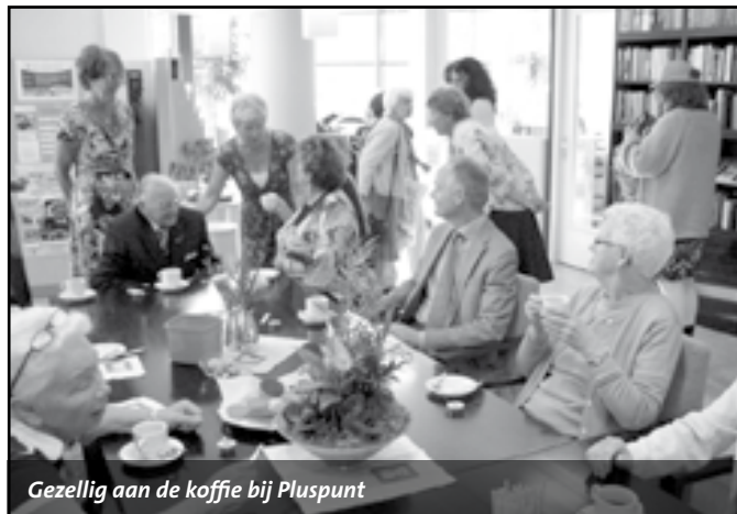
Gezellig aan de koffie bij Pluspunt

Tot slot zijn er tijdens deze feestweek ook gratis kennismakingslessen van de diverse cursussen, die door het jubilerende Pluspunt worden gegeven. Zoals improvisatietoneel (maandag 17 sept. 19.30-21.30), jazzdance 55plus (dinsdag 14.30-15.30), ouder en peutersyoga (woensdag 09.00-10.00), Spaans (woensdag 19.30-21.00), Nederlands (donderdag 10.00-12.00), Engels (donderdag 13.00-14.30), beeldhouwen (vrijdag 10.00-12.00) en hatha yoga (vrijdag 12.30-13.30). Op de uitgebreide site www.pluspuntzandvoort.nl is meer informatie over al deze cursussen te lezen.